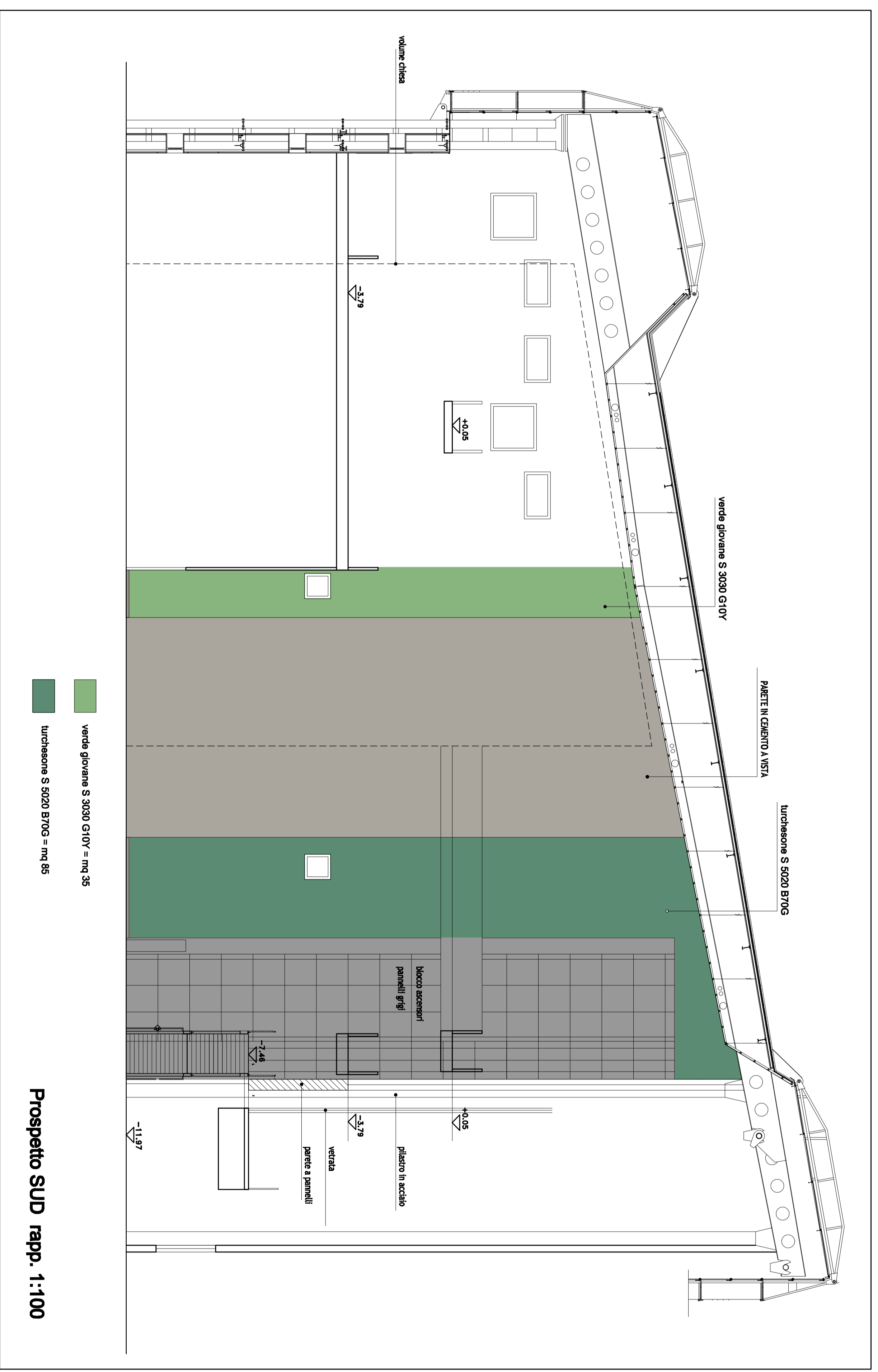
Prospetto SUD rapp. 1:100